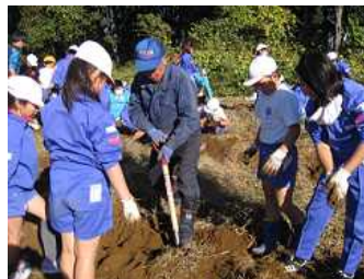
◇地域の方にもご協力いただきました