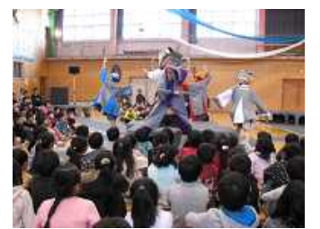
◇劇『スクラムガッシン』を鑑賞