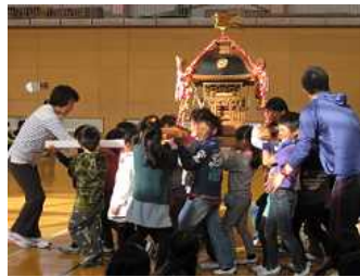
◇1年生のお神輿 《さつま芋の収穫》