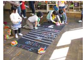
◇2年生のおもちゃやさん 《演劇鑑賞会》