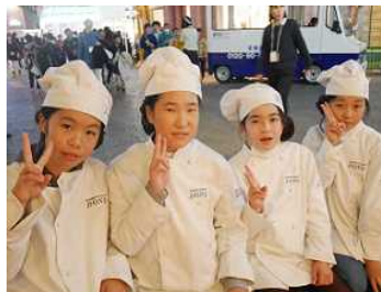
◇キッザニアでパン屋の職業体験