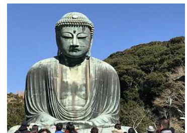
◇チェックポイントの大仏で記念写真を撮りました